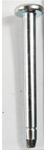
图 2.2 产品照片